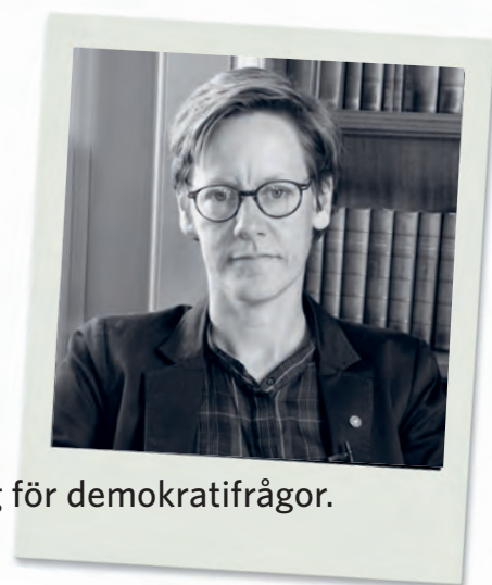
Förtroendevald (V) i Malmö och vice ordförande i SKL:s beredning för demokratifrågor.